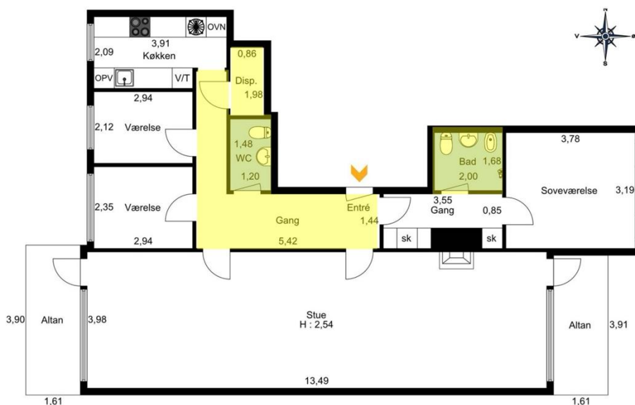
FIGUR 3: Asbest i lofterne